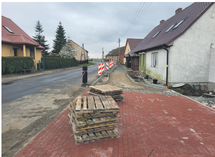
Droga Babin - Babinek

2. Drogę powiatową nr 1576Z skrz.z DW 122 Kosin – gr. pow. Barlinek na odcinku skrzyżowanie DW 122 – Kosin odcinek o długości ok. 1,5 km. Koszt inwestycji to 295 200 zł, a dofinansowanie 139 375 zł.